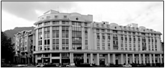
პროვკაციული წევრობასთან. ამის მიზეზი ის არის, რომ შრომითი კონტრაქტები საწარმოების უმეტესობაში იყო ხანმოკლე, დაახლოებით ერთი-ორი, ასე რომ, დამსაქმებულს შეეძლო გათავისუფლების მიზეზად დეკლარებულიყვნენ კონტრაქტის ვადის გასვლა.

გუშინ „ქართლთან“ საერთაშორისო კონფერენციის უძისაშინაო სოციალური დიალოგისა და შრომითი სტანდარტების შესახებ საერთაშორისო კონფერენცია ფორმის ებერტის ფონდის ინიციატივით უკვე შესაბამისად გაიმართა, რომელზეც შრომის საერთაშორისო ორგანიზაციასთან ერთად საქართველოში შრომითი უფრობის მფლობელი ქვეყნებიც იყვნენ. საკანონმდებლო და აღმასრულებელი ხელისუფლების წარმომადგენლები, მთავრად — დამსაქმებელთა ასოციაციის წარმომადგენლები, დასაქმებულთა ინტერესების წარმომადგენლები — პრივილეგიული კავშირების წარმომადგენლები, კონფერენციაზე ყველა მონაწილე მხარე შეთანხმდა იმ საკითხზე, რომ აუცილებელია დამსაქმებელთა სოციალური დიალოგი, რაც იმას ნიშნავს, რომ კონსულტაციები ყველა მხარე იქნება ჩართული.