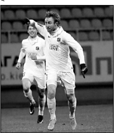
სანდრო კობახიძე უკრაინაში