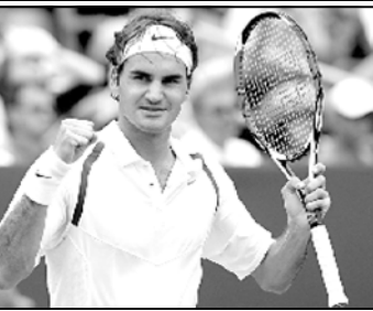
რიერის მანძილზე 76 ტიტული მოიპოვა. შეჯახსენებით, რომ ამიარული როჯერი“ ქვეყნის საუკეთესო მამაკაცი სპორტსმენად აქამდე 2003, 2004, 2006 და 2007 წლებში აღიარეს.

ლეგენდარულმა ჩოგბურთელმა როჯერი ფედერერმა მტხუთედ მოიპოვა შევიცარისის წლის საუკეთესო მამაკაცი სპორტსმენის ტიტული. უფრნალისტებმა და გულშემატკივრებმა ქალბებს შორის საუკეთესოდ ლონდონის ოლიმპიური თამაშების ჩემპიონი, ტრიატლონისტი ნიკოლა სპირინგი აღიარეს.