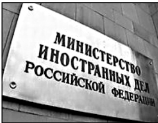
2006 წელს რუსეთმა „კავკაზ-სანტრის“ საქმიანობის აკრძალვის მოთხოვნით შვედეთს უკვე მიმართა. ოფიციალურმა სტოკოლმში ამ თხოვნის შესრულების შესახებ გაკეთდა განცხადება.

ინტერნეტ-გამოცემის „კავკაზ-სანტრის“ 1999 წელს, თვითღიარებული ოქციონის რუსულენოვანი ხელმძღვანელობის მიერ შექმნა. 2011 წელს რუსეთის ხელისუფლებამ ის ექსტრემისტულ საიტად გამოაცხადა და ამ მოქმედების საიტის სერვერი ოფთომობა განთავსებული, თუმცა საიტის მოსტინგს ნიშნა ლტენისა და შვედეთის პროზიდერებზე წარმოადგენდნენ. რუსეთმა „კავკაზ-სანტრის“ დახურვის მოთხოვნით ფინანსს მიმართა, თუმცა ხელისუფლებისგან უარი მიიღო.