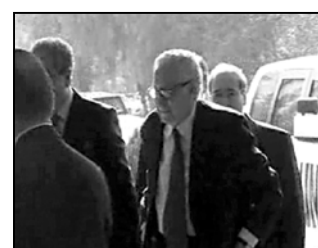
შეუდნენ და სირიის შიარაღებულ ოპოზიციის რეგენი შეესაქმნა, – ირმმუნტა ირანული საავტონო „ფარისი“. ახვე საავტონო მტკიცებით, ჩვენთვის სირიაში თურქეთის, აზერბაიჯანის, საქართველოს და დიდი ბრიტანეთის გაერთიანებული სამეფოს წარმომადგენლები.

თელ-ავივი ამ ტომის 50 წევრს წარმომადგენელი ჩაივდა და ასევე 7 ათასმა მათმა წარმომადგენელმა ისრაელის მთავრობის წევრებს აიღო, რომ ისინი ინფორმაციას სარგებლობდნენ.