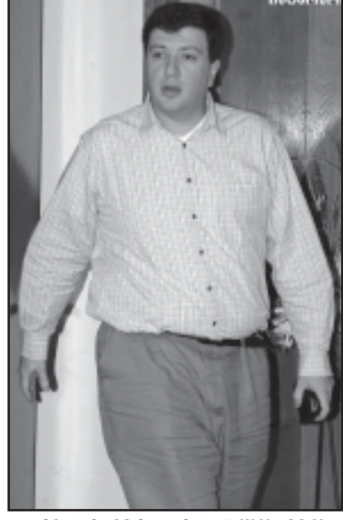
შერს ექცევირებას, ქალაქის შერს ექცევირებას...