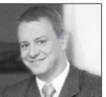
სათელეკომუნიკაციო სფეროში ევროპის ერთ-ერთმა მოწინავე და წარმატებულმა კომპანია...