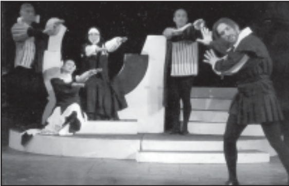
მეორედადგენა... მეორედადგენა... მეორედადგენა...