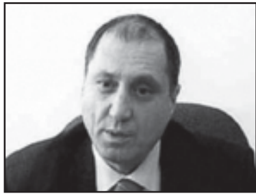
ლო ანას მიხანდვასიანს და თანამედროვე რუსულ ასრულვას...