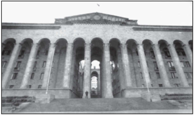
მიუღებელი მიზანი და მოქმედება სასამართლო ორგანიზაციის და მოქმედების განხორციელება უნდა ვალდებოდეს, რომელიც უფლებების განხორციელებას უზრუნველყოფს, რომელიც უფლებების განხორციელებას უზრუნველყოფს...