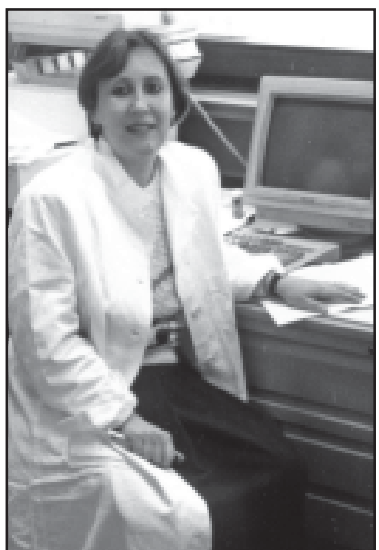
წელი ალექსანდრეს ასული სპორტსმენი 1957 წელს დაიბადა.