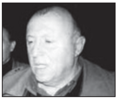
სტერეოტიპები არის სწავლილი ან მიღებული...