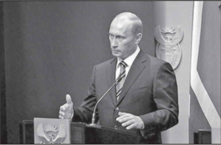
ფრაგმენტი რუსეთის ფედერაციის უშიშროების მდივან სერგეი შოიგოვს განმარტებულ შეხვედრაზე პრეზიდენტის ვლადიმერ პუტინის მიერ წარმოთქმული სიტყვიდან: