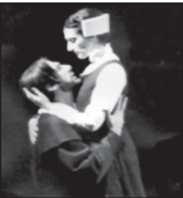
მეორედადგენა... მეორედადგენა... მეორედადგენა...