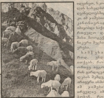
ადგილობრივი პირუტყვის მრავალფეროვნება

მური ცხვრის მეტადიერი მრავალფეროვნება ადგილობრივი პირუტყვი კომპლექსური უწყობის მანქანებისა და მჭივი მოწყობის გამოყენების გამოყენების შედეგად, ადგილობრივი პირუტყვის