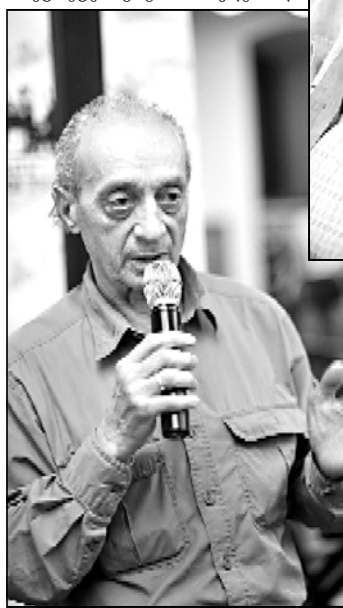
ბათ პოლიტიკოსები, მაგრამ, როგორც ყო-

გურამ ფირცხალავა: ესაა უჭკვიანესი, უნიჭიერესი პუბლიცისტი, ჟურნალისტი. ყველაფერი მგონია მე არმაზი – ჩემი თაობის აღმზრდელი, ჩემი თაობის აღმზრდელიცა და ახალი თაობის აღმზრდელიც. ძალიან საინტერესო ადამიანი. რაზეც დაუწყებია და რისთვისა ხელი მოუყვანდა, ყველაფერი ძალიან ნიჭიერად და სა-