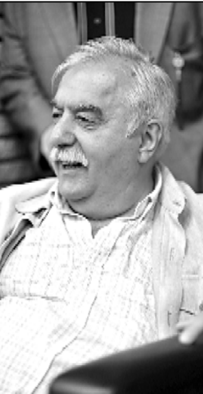
თი წლის მონაგარი“ პირობითად, უფრო ნაკლებსაა.

სხვათა შორის, რომ გვექნებათ საშუალება (ჯერ სურვილი) და წიგნს წაკითხავთ, ნახავთ, რომ რესპონდენტებს ძალიან რადიკალური მოსაზრებები აქვთ, მაგრამ ძალიან კეთილგანწყობილები არიან.