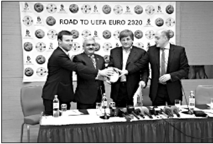
ზეადა სიქინავის არსებული მდგომარეობა, წარმოადგენს კონკრეტულ ნიშანდებებს, რის შემდეგაც 30 ივნისამდე მომზადდება უფაში წარმოადგენს ერთობლივი განაცხადი.

ამ თემაზე მხანამედ უკისმისტური აზრის ვიყავით, თუმცა საქართველოს ფეხბურთის ფედერაციამ დაარწმუნებული არიან, რომ ყველა ერთი სახესხატით რეაგირებენ. და ეს იმის ფონზე, რომ ევრო-2020-ის მასპინძლობაზე გვერმანდო და მოლაინადია თავიანთი კანდიდატურები მოხსნან. ხოლო, სტამბულში გამართულ შეხვედრაზე უფა-