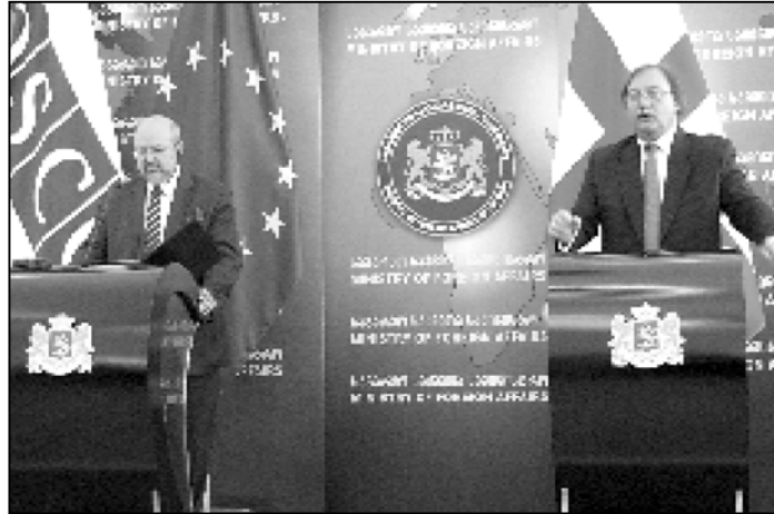
საპარლამენტო ასამბლეის რეზოლუციაში, – აღნიშნულია დოკუმენტში.

– უთოს საპარლამენტო ასამბლეა მოუწოდებს ყველა ჩართულ მხარეს, დაიცვას საერთაშორისო სამართლის პრინციპები, სრულად შეასრულოს ევროკავშირის შუამავლობით მიღებული შეთანხმება ცეცხლის შეწყვეტის შესახებ და გააძლიეროს ყენევის პროცესი. ორგანიზაცია დაჟინებით მოითხოვს რუსეთის მთავრობისა და პარლამენტისგან, ასევე აფხაზეთისა და სამხრეთ ოსეთის დე ფაქტო ხელმძღვანელებისგან, შეფერხებების გარეშე დაუშვას ევროკავშირის სადამკვირვებლო მისია ოკუპირებულ აფხაზეთისა და სამხრეთ ოსეთის ტერიტორიაზე და სრულად თანამშრომლობის მასთან, ისე, როგორც არის შეთანხმებული ცეცხლის შეწყვეტის შესახებ ხელ-