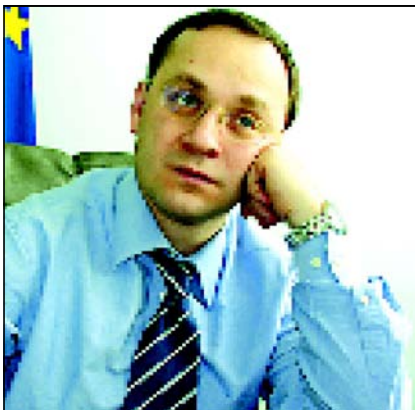
ივანიშვილის სამსახურში სია