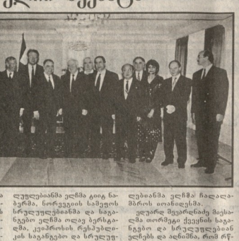
ახალი საგანგებო და სრულუფლებიანი ელჩები საქართველოს საგარეო უწყებაში.