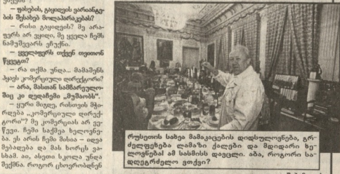
სახიანი პარტი... (Caption text describing the image)

სახიანი პარტი... (Main text of the article, starting with 'სახიანი პარტი...')