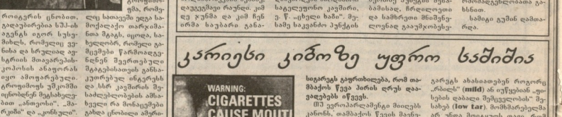
ერთი ჩინეთს პარტის საბიუროსი... (Caption text describing the image)

ერთი ჩინეთს პარტის საბიუროსი... (Continuation of the article text)