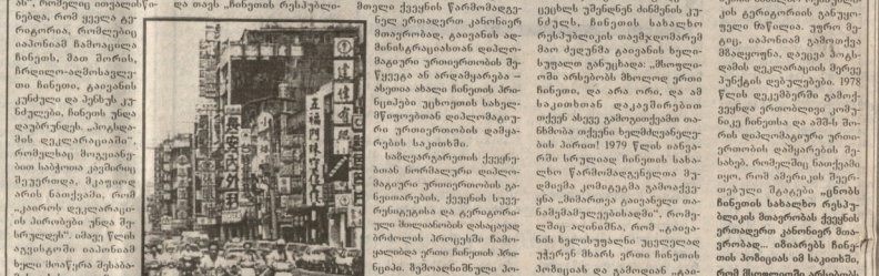
ერთი ჩინეთს პარტის საბიუროსი... (Caption text describing the image)

ერთი ჩინეთს პარტის საბიუროსი... (Text of the article, starting with 'ერთი ჩინეთს პარტის საბიუროსი...')