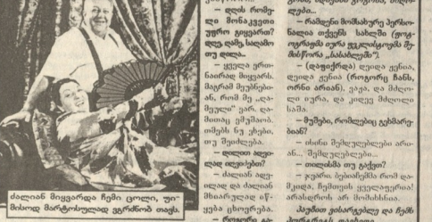
სახიანი პარტი... (Caption text describing the image)

სახიანი პარტი... (Continuation of the article text)