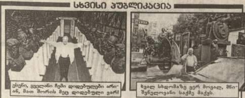
სახიანი პარტი... (Caption text describing the image)

სახიანი პარტი... (Main text of the article, starting with 'სახიანი პარტი...')