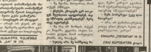
სახიანი პარტი... (Caption text describing the image)

სახიანი პარტი... (Continuation of the article text)