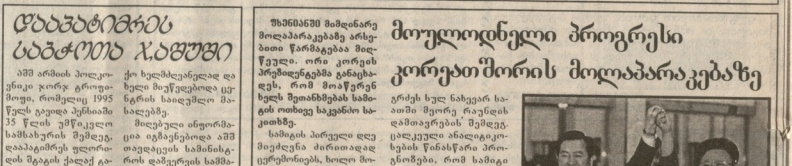
ერთი ჩინეთს პარტის საბიუროსი... (Caption text describing the image)

ერთი ჩინეთს პარტის საბიუროსი... (Continuation of the article text)