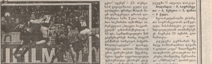
ნაღდი ფეხბურთი აწი იყება... 33რთ - 2000