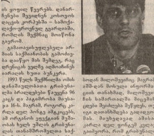
ჰააკის ტრიბუნალი: ეჭვქვეშ არის „გამათავისუფლებელი არმი“