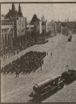
გრაფიკული დოკუმენტი... საიდუმლო მთლანარაკება...