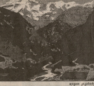
დავით კაკაბაძე „მინერალი“