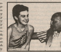
მუსიკალური მაგის მეგობერი პირმშო