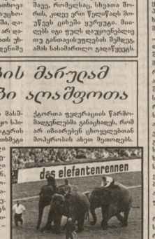
ამის მხრივ რეაგირებს მნიშვნელოვანი მნიშვნელობის მქონე რეზიუმეები თანამშრომლობის მიზნით.

მნიშვნელოვანი მნიშვნელობის მქონე რეზიუმეები თანამშრომლობის მიზნით. მნიშვნელოვანი მნიშვნელობის მქონე რეზიუმეები თანამშრომლობის მიზნით.