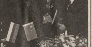
ამის მხრივ რეაგირებს მნიშვნელოვანი მნიშვნელობის მქონე რეზიუმეები თანამშრომლობის მიზნით.

მნიშვნელოვანი მნიშვნელობის მქონე რეზიუმეები თანამშრომლობის მიზნით. მნიშვნელოვანი მნიშვნელობის მქონე რეზიუმეები თანამშრომლობის მიზნით.