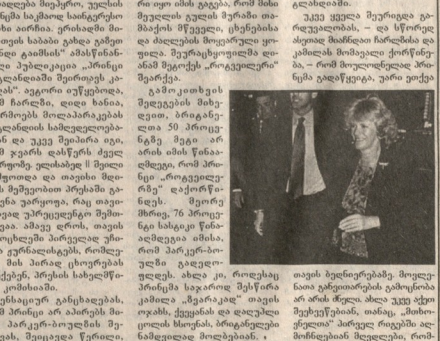
ამის მხრივ რეაგირებს მნიშვნელოვანი მნიშვნელობის მქონე რეზიუმეები თანამშრომლობის მიზნით.

მნიშვნელოვანი მნიშვნელობის მქონე რეზიუმეები თანამშრომლობის მიზნით. მნიშვნელოვანი მნიშვნელობის მქონე რეზიუმეები თანამშრომლობის მიზნით.