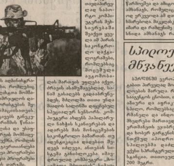
ამის მხრივ რეაგირებს მნიშვნელოვანი მნიშვნელობის მქონე რეზიუმეები თანამშრომლობის მიზნით.

მნიშვნელოვანი მნიშვნელობის მქონე რეზიუმეები თანამშრომლობის მიზნით. მნიშვნელოვანი მნიშვნელობის მქონე რეზიუმეები თანამშრომლობის მიზნით.