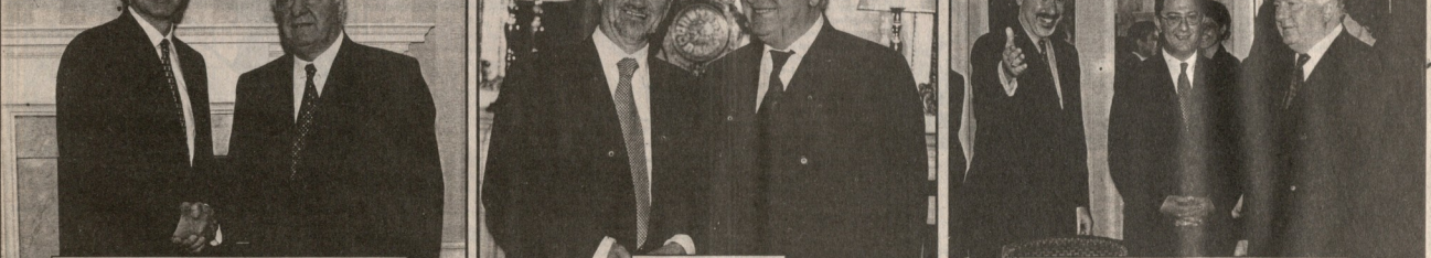
ფოტო: ვიზიტის მიზანობა, რომელიც დადგინდა, რომელიც დადგინდა...