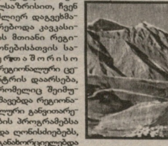
საქართველოს მთის პრობლემების შესახებ