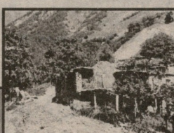
საქართველოს მთის პრობლემების შესახებ