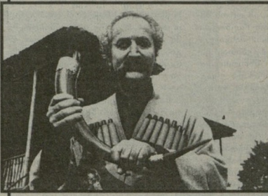
ბერი. ამ უკანასკნელს თურმე განსაკუთრებული წარმატება ხვდა...