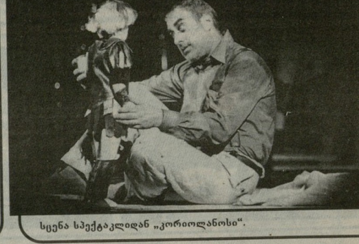
სცენა საქმეკლიდან „კოროლანოსი“.