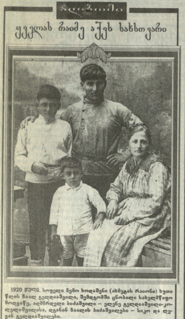
1920 წელს, სოფელ ზემო ხოქანეთში (ახლანდელი ბათუმი) სიბერეში მყოფი მეფე გიორგი V და მისი ცოლი მარია II. მათთან ერთად სწორედ ადამიანურად სწავლილი მეფე გიორგი V და მისი ცოლი მარია II.

საქართველოში მნიშვნელოვანი როლი დაიკავა გიორგი V-ის მემკვიდრეობამ, რომელიც მათი ცხოვრების დროს დაიწყო. მეფე გიორგი V და მისი ცოლი მარია II-ის მემკვიდრეობის დაზოგვის საკითხი კარგად ადასტურებს. მათმა შვილებმა და ბებია-ბაბუებმა მათი სახელი და პატივი შეინარჩუნეს.