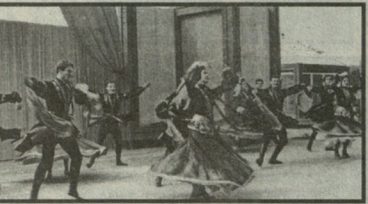
როგორც დოკუმენტური მასალა, ასევე ფოტოსურათები, პრინციპი, სივრცეები, დიდი...