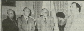
სინასო მირიბული კონკრეტული მუსიკის კონკრეტული...