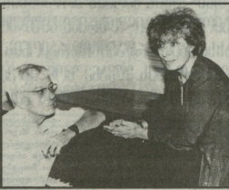
მწვერიერ საქართველოს საერთაშორისო ხალხური მუსიკის...