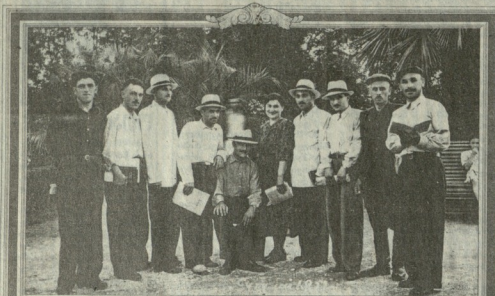
სწავლის პერიოდში ინსტიტუტის ისტორიის ფაქტობრივი ხელნაწილი ხელნაწილი გახდა...