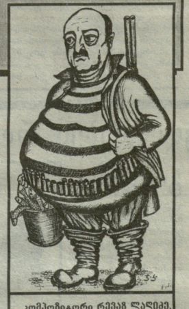
კომპოზიტორი რამაზ ლაშვი.