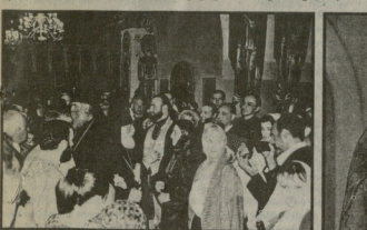
ტადარი არ იკეტება, რადგან მისი მფლობელები არ არიან...