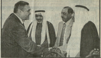
საქართველოს მთავრობის განკარგულებაში აღიარდა, რომ თანამშრომლობა ახალ იმპულსს შეიძინა.

საქართველოს მთავრობის განკარგულებაში აღიარდა, რომ თანამშრომლობა ახალ იმპულსს შეიძინა. ეს გადაწყვეტილება მიიღო საქართველოს მთავრობის განკარგულებაში.