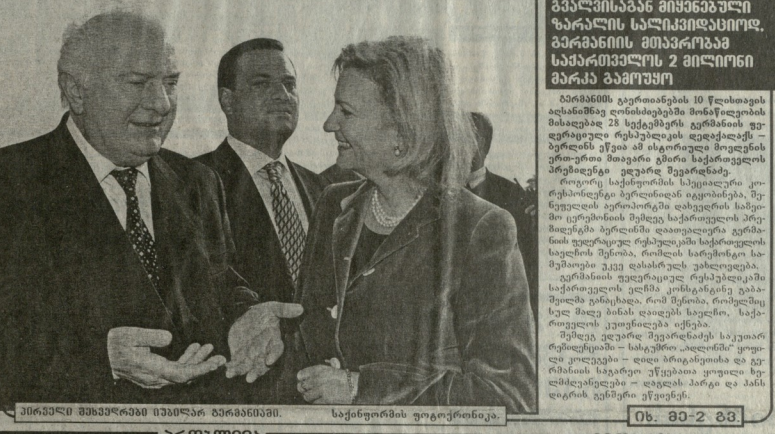
ედუარდ შევარდნაძე საქართველოს პრეზიდენტად.

გერმანიის ევკლა მოქალაქე მადლიერებით არის გამსჭვალული. ეს განცხადება გააკეთა გერმანიის ევკლა მოქალაქე მადლიერებით არის გამსჭვალული. ეს განცხადება გააკეთა გერმანიის ევკლა მოქალაქე მადლიერებით არის გამსჭვალული.