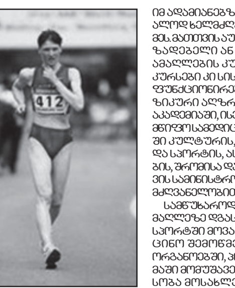
ჯანსაღი სულის დასაბუდებლად...