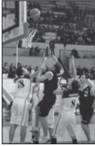
ვაკეში XVI ეროვნული ჩემპიონატის I ტრენინგული მატჩის...