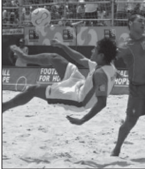
ვაკეში XVI ეროვნული ჩემპიონატის I ტრენინგული მატჩის...