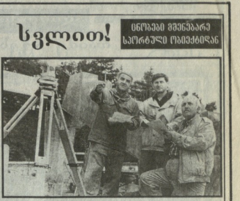
სრული სვლითი გუნდის შემადგენელია...