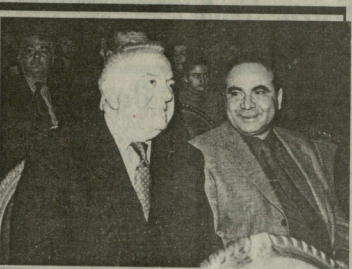
მ. 80-2 83

აზხაზეთის ხელოვნების ოსტატთა კონკერტი რომელიც მიიღეს საერთაშორისო სახელმწიფოპროგრამის 3000 წლისთვის და არისსა დაბადების 2000 წლისთვის აზხაზეთის ხელოვნების ოსტატთა კონკერტი, რომელიც მიიღეს საერთაშორისო სახელმწიფოპროგრამის 3000 წლისთვის და არისსა დაბადების 2000 წლისთვის, გაიმართა თბილისში. კონკერტი დაიწყო 19:00 საათზე. მასში მონაწილეობდა 150-ზე მეტი მუსიკოსი. კონკერტის პროგრამაში შედიოდა აზხაზეთის ხელოვნების ოსტატთა კონკერტის 150-ზე მეტი მუსიკოსის შემადგენელი ნაწილი.