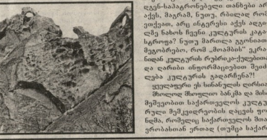
სადაც უკლებლივი პეტიცია...