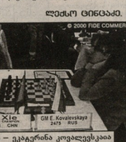
საუ თენი - კატაგინის კონფიდენციალი