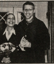
კუხელი გამთავალი, ახლა გერმანიის მონიქი