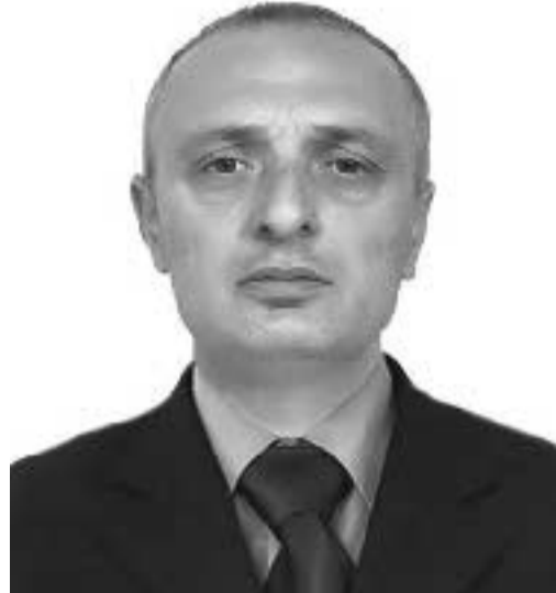
ნაწილი — ორპარტიული პარლამენტი, ფაქტობრივად, სახეზეა.

— დიახ, 26% მათთვის, ჩემი აზრით, ძალიან დიდი წარმატებაა და ისიც, რომ მათი იდეოლოგიების ჩანაფიქრის ძირითადი