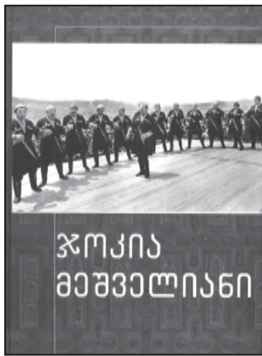
სასიხარო სახარებას უსმენენ ხალხი.

ეს არის იმ ადამიანი, რომელიც გვემსახურა და გვემსახურება. ეს არის იმ ადამიანი, რომელიც გვემსახურა და გვემსახურება.