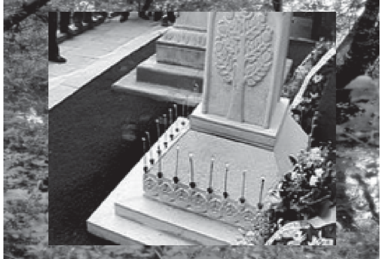
რილოს ბარელიეფით და საგებდრო და რელიეფური სიგელოიკით (სკულპტორი იოსებ ანდრიაძე). საფლავის ქვას განსაზღვრავს, რომელიც, რა თქმა უნდა, „მარდების რევოლუციის“ მიუძღვნა,

მინც ეგზოტიკური და კოლორიტული ქალაქი თბილისი ეკლექტიკური ქალაქად გადაიქცა... და ამისთვის დაიხარჯა მილიონები... იყო სხვა პარადოქსებიც: შენდებოდა ფეხნებოდალი, უზარმაზარი მარმარილოს საფლავები... და არა მარტო მიცვალებულთა მემკვიდრეობა... მამალი-თადამერიის სრულიად ჯანმრთელი თანამგრომლისა და მისი ასევე ცოცხალი და ჯანმრთელი ოჯახის წევრებისთვის. მათ კარგად ყოფნას ვუსურვებდით მგზავს და ახლაც და დამ, ასი წლის მერე მიიცივალონ, მგზავს როგორც ჩანს, ფიქროვან: თუკი საშუალება არსებობს, რატომაც არ უნდა დაიბეჭდოს საფლავი – იგივე კაპიტალი... გმირის შიშველ საგარეს კი აწვივებდა და ათობოდა... და გოლოს, აღსრულდა... გაკეთდა ქაშუცას საფლავი, მარბ-