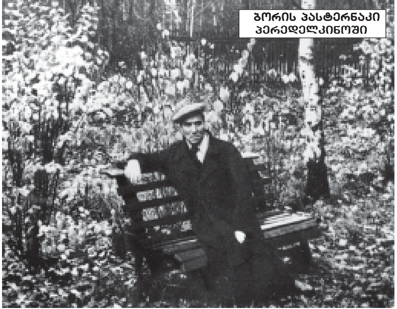
გორის პასტერნაკი პირადელკინოში

არა, ჩემო ძვირფასო, თუ დღეს დუნიაზე საბურთალოში ვიყავი მიცემულს, ორ-სამ წელიწადში ისინიც ალბათ იმდენიან... (წერილი გრძელდება სრულიად მოულოდნელი აღსარებით და რთული ფსიქოლოგიური ნიშნავლებით... ეს ეპისტოლე შემოკლება და კუვირების სახით, 1966 წელს „გორის ლიონებზე“ ში დაიბეჭდა. 1968 წელს ქალბატონი რაინა მიძახი პასტერნაკის ვაჟისგან იღებს ბარათს. ივანე პასტერნაკი მას თაყვანის თხოვნით მიმართავს: „მეგზავს ძარბაღს კინაღამ რომანი დაგეფყო, რომელიც გვამოგონებდა, რომელიც გვამოგონებდა...“