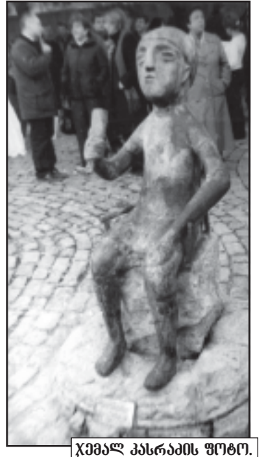
ქამალ პასრაძის შრომა.

„თამადამ“ თბილისი დაამშვენა გუშინ თბილისში, გაგის რიგისა და ზარდინის ქუჩის გადაკვეთაზე გაიხსნა ვანო აღმორჩენილი კვ. წ. აღ. VII საუკუნის პირველი ქანდაკება (ასლი - „თამადა“). ლონისძიების ორგანიზატორები არიან საქართველოს სპორტო-სამრეწველო პალატა და საქართველოს ეროვნული მუზეუმი.