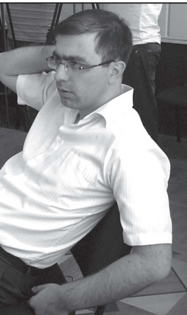
გაკავა. ექვქვე არავინ აყენებს არჩევნების ლეგიტიმურობას.

— ყველა განცხადება იმის თაობაზე, რომ ჩამოვიდა და ბიძინას დაამხოვს, აძლევდა ახალ სტიმულს იმ ამომრჩევლებს, რომელიც არ აპირებდა „ქარ-