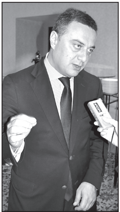
ეს დადებითი გარემო და ქვეყანა უნდა წავიდეს წინ. ყველანი უნდა შევთანხმდეთ იმაზე, რომ ეს წინასწარჩვენო

– ჩვენ, თავისუფალი დემოკრატები, ვფიქრობთ, რომ დღეს ყველაზე მნიშვნელოვანია ის, რომ ქვეყანაში სტაბილური, ნორმალური, ღია საარჩევნო გარემო იყოს. ჩვენ უნდა შევინარჩუნოთ