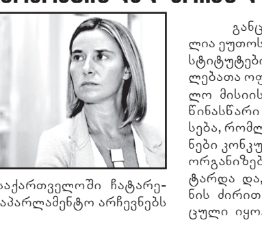
ლიც საქართველოში ჩატარებულ საპარლამენტო არჩევნებს ეხება.

– ჩვენ მზად ვიქნებით, ვიმუშაოთ დემოკრატიულად არჩეულ ხალხს პარლამენტთან და მთავრობასთან საარჩევნო პროცესის დასრულების შემდგომ. ამის შესახებ ნათქვამია ევროკავშირის უმაღლესი წარმომადგენლის, ვიცეპრეზიდენტ ფედერიკა მოგვიანისა და ევროკომისიის იოჰანეს ჰანის ერთობლივ განცხადებაში, რომე-