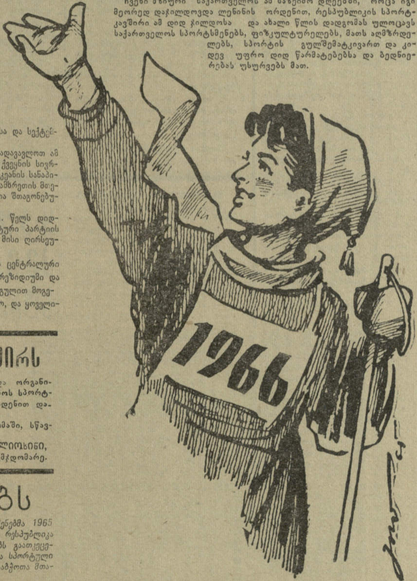
ნან. გ. იაშვილისა.

ჩვენი მზიური საქართველოს ამ საწიგნო დღეებში, როცა იგი მეორედ დაჯილდოვდა ლენინის ორდენით, რესპუბლიკის სპორტკავშირი ამ დიდ ჯილდოსა და ახალი წლის დადგომას ულოცავს საქართველოს სპორტსმენებს, ფიზკულტურელებს, მათს აღმზრდელს, სპორტის გულშემატკივართ და კიდევ უფრო დიდ წარმატებებსა და ბედნიერებას უსურვებს მათ.