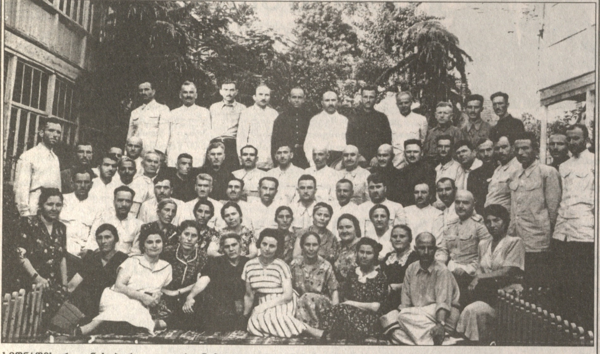
სინარქოს რაიმის პარტიულ ორგანიზაციის მდივნების სემინარის მსმენელები. 1945 წლის 9 ივლისი.