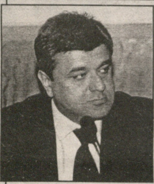
ცოლშვილიანია, ჰყავს ორი შვილი. წარმოშობით კახეთიდანაა, ქიმიკიდან. მამამისი წლების განმავლობაში ანალიზებულსაწყობში, ხოლო დედა ცეკავშირის უნივერსალურ ბანკში...