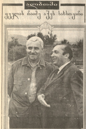
საქართველოს პრეზიდენტი მიხეილ სააკაშვილი

ახალ კონსტიტუციურ რეჟიმს მივყავართ... 2001 წლიდან „საქართველოს რესპუბლიკა“ სელმძვრნა იღვდება!