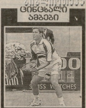
დანიშვი ტრეპლბა მუხეფრე...