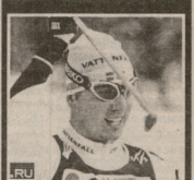
მედიის პირი ელვიტორნი ფი...