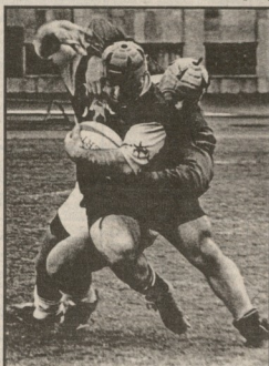
შეიქი, რომ მე-2 წუთში მედლითმე...