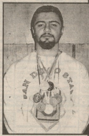
საეპრობისა 4 მსხველი 10-10 ვი...