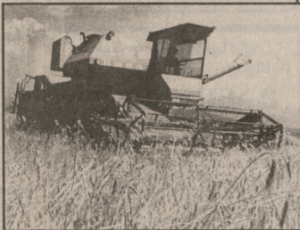
ავთოგონი მანქანების გამოყენების შესახებ

კანონი შეიქმნა, საპარტიო მუშაობის გამოყენების შესახებ დღევანდელი მთავრობის მიერ მიღებული კანონის პროექტი, რომელიც დაკავშირებულია შირაქის დაბურებული ყანების გამოყენების შესახებ, მიზნობრივად დაკავშირებულია შირაქის დაბურებული ყანების გამოყენების შესახებ. მისი მიზანია, უზრუნველყოს შირაქის დაბურებული ყანების გამოყენების შესახებ.