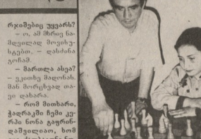
ენგურის ნაპირებიდან - კალითაგამე