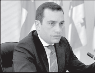
„თავის უფალი დემოკრატები“ იმიტომ ვართ თავისუფალი დემოკრატები, რომ ერთმანეთს თავისუფალ სიფრცხვანო ვუტოვებთ, — აცხადებს ირაკლი ალასანია გადმოცემა „არჩევანი“ საუბრისას.

მისი თქმით, ვინც ნავი- და და დატოვა პარტია, ეს იყო მათი თავისუფალი არჩევანი, რადგან მათ დაინახეს, რომ პოლიტიკაში ყოფნა არ უნდოდათ. „თავისუფალი დემოკრატები“ გამოვირჩეოდით პროფესიონალიზმით, ვიყავით პროფესიონალების გუნდი, რომელიც პოლიტიკაში მოვედით საჯარო სამსახურებიდან, თუ მათ შინაა გადავდებთ რომ ავითონ ღირებული საქმე ქვეყნისთვის, მე ვისურვებდი მათ ნახვას ამ სფეროში,“ — განაცხადა ალასანიამ. ალასანია გავრცელებულ ინფორმაციასაც გამოეხმაურა იმის შესახებ, რომ შესაძლოა, მისი გუნდის ყოფილი ნევრებმა მალალი თანამდებობი დააკავონ ხელისუფლებაში. „მე სხვის ნაცვლად ვერ ვისაუბრებ, მაგრამ ვიცი რომ მე არანარი თანამდებობის დაკავებას არ ვაპირებ სახელმწიფო სექტორში,“ — განაცხადა ალასანიამ.