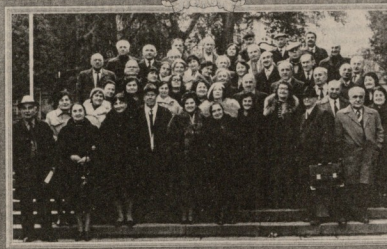
1942 წლის ბავშვთა სახსოვარი. მარჯვნივ: 1942 წლის ბავშვთა სახსოვარი. მარჯვნივ: 1942 წლის ბავშვთა სახსოვარი.

მარჯვნივ: 1942 წლის ბავშვთა სახსოვარი. მარჯვნივ: 1942 წლის ბავშვთა სახსოვარი.