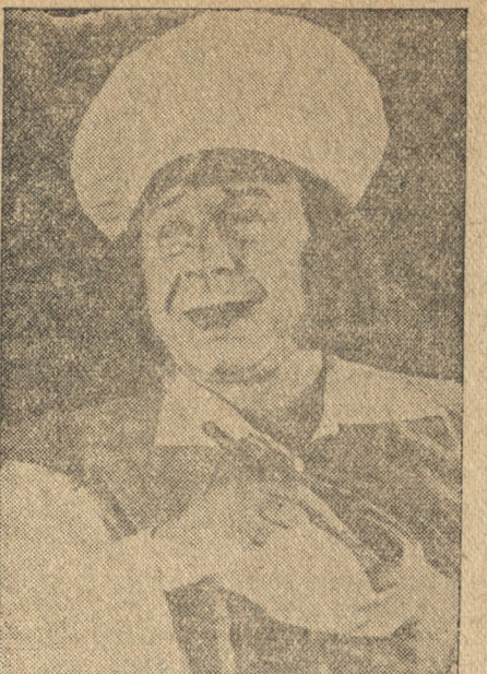
ქრისტან — გ. ხაბაძე.