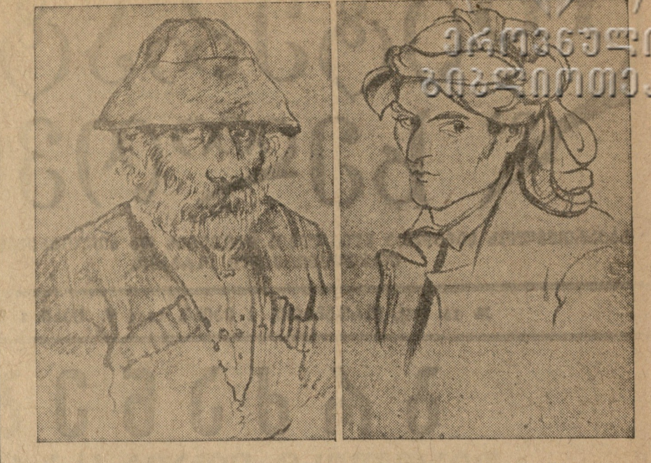
სენი კომპოზიციები, ნახ. მოსე თოძისა, გერული კომპოზიციები ნახ. მოსე თოძისა.