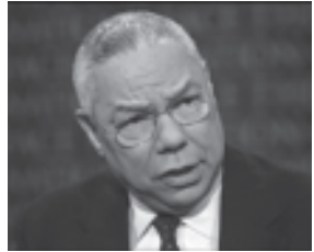
შეერთებული შტატების არმიის სამხედრო მოსამსახურეთა რიცხვის გაზრდაც კი ვერ შეცვლის ერაყში არსებულ „კალა სერიოზულ“ ვითარებას, რომელიც სულ უფრო უარესდება“.