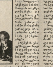
საქართველოს უმრავლესობის მოვალე მინისტრი ლეონი აშვალაპი

საქართველო... (Text contains various news items and reports from Georgia.)