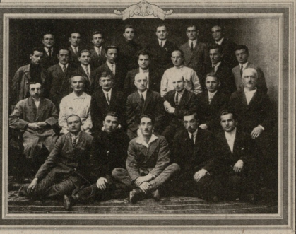
ეკვოს რაიბე აქვს ხახხოვაზი