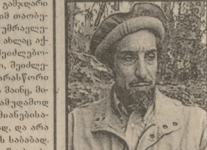
მამა მამულა, ადგილობრივი მნიშვნელობის პოლიტიკოსი...