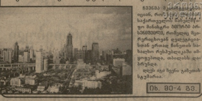
ჩინეთი - ასე შორეული და ასე ახლოებული