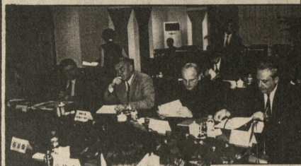
საგარეო უწყების მდივანი