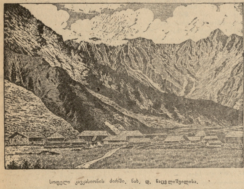
სოფელი კავკასიონის ძირში. ნახ. დ. ნაცვლიშვილისა.

ლენინგრადის კინოსტუდია წესად დაიწყო სურათის „არმიის ვენერალის“ გადაღებას ბ. ჩირსკოვის სცენარით.