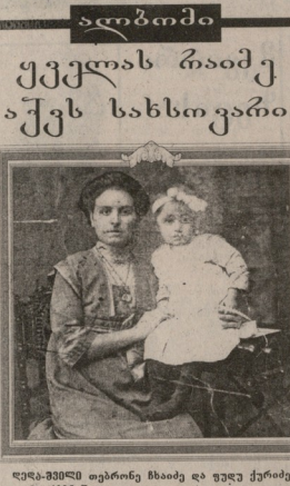
ელა-შაში უფროსი მხაძე და დედა ქროძე ბაბუი, 1905 წელს. ფოტო მიწავიდა მამა ქროძისათვის