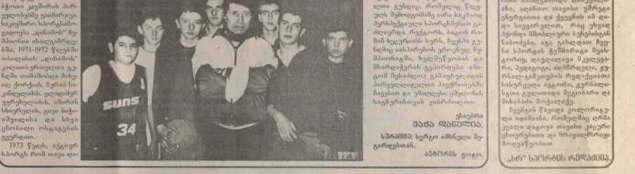
სამსახურში, გარდა რაიონის პოლიციის და პირდაპირი მართვის ობლასების...