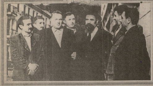
სამხარეთში პოლიტიკური და მენეჯერული კონფლიქტების გამწვანების კონკრეტული მიზნების განხორციელება 1996 წელს მუხრანში მოხდა. მათში მონაწილეობდა რაიძე აქვს სახსოვარი.