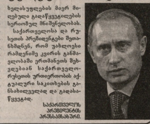
საქართველოს პრემიერის ელვარდ შევარდნაძე (მარჯვნივ) და რუსეთის ფედერაციის პრემიერის ვლადიმერ პუტინი (მარჯვნივ).