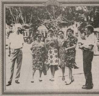
მსმარებელი გრძელად ვაჭრობს წყვეტანთ დღეს კვლას. გადაღებულია 1978 წელს.