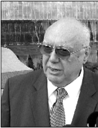
ნალური მოძრაობის» ახირების მქვეალი, - განაცხადა მან პარლამენტის საიკერმა.

რუსთაველზე მდებარე შენობის იმ კონდიციამდე მისაყვანა, რომ იქ მუშაობა შესაძლებელი გახდეს, სამუშაოები გრძელდება და დამთავრებულ ეტაპზეა. ძირითადად ტექნიკური საკითხებია დარჩენილი, მიმდინარეობს დარბაზების მოწყობა. საკარაულოდ, თებერვლის ბოლოს - მარტის დასაწყისში სამუშაოები დასრულდება. ამ დროიდან გვექმნება კონკრეტული გეგმა და კონკრეტული პასუხები იმაზე, რა რესურსი ვიშვებებთ. საკონსტიტუციო უმრავლესობა რომც გვექმნება, ეს იმას არ ნიშნავს, რომ კონსტიტუციაში ცვლილებები მარტშივე შევა, რადგან ახალი მოდელის მიხედვით, თუკი კონსტიტუციაში ცვლილებების მიღება მარტში დაინიყება, ყველაზე ახლოს სექტემბერში დასრულდება, მაგრამ კონსტიტუციაში ცვლილებების გარეშე არის შესაძლებელი, რომ მიშვედნულიყვნა და გაუჭვბობდეს ჩვენი მუშაობა თბილისში. დეტალბზე ახლა არ და ვერ ვისაუბრებთ, მაგრამ პარლამენტის შენობაში სარემონტო სამუშაოების დასრულების კვალობაზე მოვალსებენ საზოგადოებას ძალიან კონკრეტული სტეპის იმის თაობაზე, თუ როგორ გააგრძელდება პარლამენტო მუშაობის. ცხადია, ეს იქნება კონსტიტუციის და საკანონმდებლო კანონმდებლობის მიხედვით. არ ვპირბებთ კონსტიტუციის მიღება გარკვეულ, მაგრამ არც იმას ვაპირბებთ, რომ ვიყოთ «ნაციონალური მოძრაობის» ახირების მქვეალი, - განაცხადა მან პარლამენტის საიკერმა.