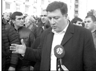
ბევრი დრო, ენერჯია და ნერვები. როგორც ჩანს ეს უნდა გახდეს

ჯვარი-სორგას ელექტროგადამცემი ხაზის პროექტი წარმოადგენს „შავი ზღვის ელექტროგადამცემი ქსელის პროექტის“ ერთ-ერთ უმნიშვნელოვანეს კომპონენტს, რომელსაც საქართველოს მთავრობის თხოვნით ახორციელებს „ევროპის რეკონსტრუქციისა და განვითარების ბანკი“ (EBRD), „ევროპის საინვესტიციო ბანკი“ (EIB), „გერმანიის რეკონსტრუქციის საკრედიტობანკი“ (KfW) და „ევროპის სამეზობლო საინვესტიციო ფონდი“ (ECNIF). პროექტის მთლიანი ღირებულება 270 მილიონ ევროს შეადგენს.