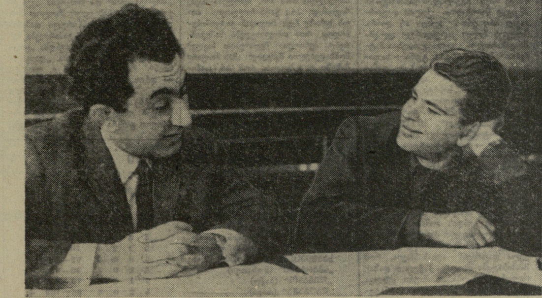
პეტროსიანიანი (მარჯვნივ) და ბოლესლავსკი (მარცხენა).