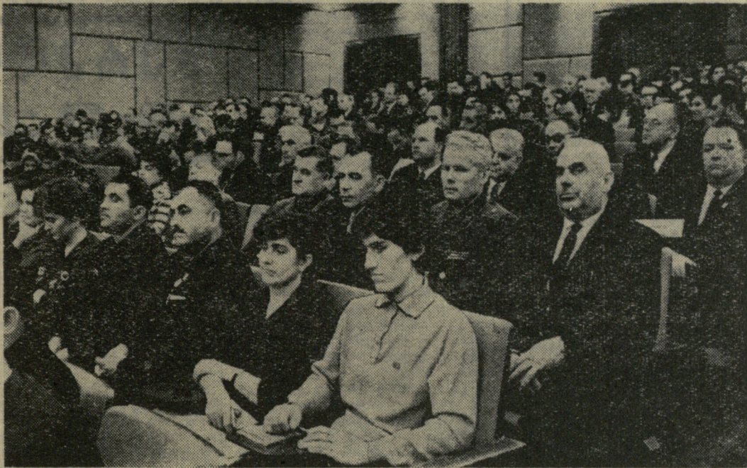
სურათზე: საბჭოთა კავშირის კომუნისტური პარტიის XXIII ყრილობის სხდომათა დარბაზში. წინა პლანზე საქართველოს სსრ დელეგაცია.