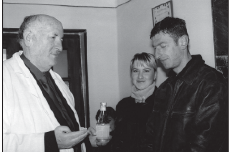
ქალაქის ადმინისტრაციის უფროსი აცხადებენ, რომ 113 ჰექტარი ფართობის „ამოღება“ გადაწყვიტეს და უთუოდ გადასინჯავინ პარკის პროექტს.

„ზურდილაძის“ ფილიალი გურანაღმარა მკურნალობის სახეობის განვითარებას უწყობს. თუმცა, ადრე თუ გვიან მოვიდოდა სახალხო მედიცინის მემკვიდრეობის დაკარგვის საფრთხე.