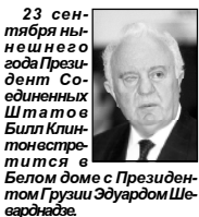
23 сентября нынешнего года Президент Соединенных Штатов Билл Клинтон встретится в Белом доме с Президентом Грузии Эдуардом Шевардnadze.

Президент Шевардnadze выступит с речью в Нью-Йорке, на за-