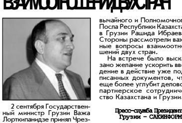
2 сентября Государственный министр Грузии Важа Лорткипанидзе принял Чрез-

РАССМАТРИВАЮТСЯ ВОПРОСЫ ВЗАИМООТНОШЕНИЙ ДВУХ СТРАН Вашингтон и Полномочного Посла Республики Казахстан в Грузии Рашида Ибраева. Стороны рассмотрели важные вопросы взаимоотношений двух стран.