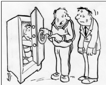
Этот футболист нам очень дорого обошелся. Рис. Вахтанг КИЛИЯ

...В ресторане Токийского Дома прессы, где проживало подавляющее большинство журналистов, к нашим услугам были три раздаточные - с европейской кухней, азиатской и японской.