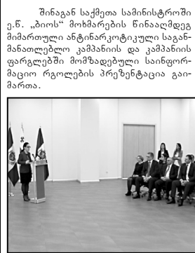
კამპანიის მიზანია ე.წ. ბიონარკოტიკის გამოყენების პრევენცია და მისი აღმოჩენის ინფორმირება. კამპანიის ფარგლებში გადადებული საინფორმაციო ელემენტები მომხმარებელთა მიერ მიქალაქებს მიაწოდებულ ინფორმაციას, თუ რა საფრთხეებს შეიცავს მათი ჯანმრთელობისთვის. ბიონარკოტიკის მოხმარება. საინფორმაციო რგოლები ტელე და რადიო-ფორუმებში, კინოთეატრებსა და სოციალურ ქსელებში განთავსდება. შსს-ს გადაუდებელი დახმარების ოპერატიული მართვის ცენტრ „112“-ის მიერ ასევე მომზადებული საინფორმაციო რგოლი, რომლის მეშვეობით საზოგადოება იმ პირველადი სიმპტომების შესახებ შეიტყობს, რაც ე.წ. „ბიოს“ მოხმარებას ახასიათებს და აღნიშნული სიმპტომების შემთხვევაში, სასწრაფო დახმარების გამოძახების აუცილებლობაზე მიიღებს ინფორმაციას.

ბიონარკოტიკის გამოყენების პრევენცია და მისი აღმოჩენის ინფორმირება. კამპანიის ფარგლებში გადადებული საინფორმაციო ელემენტები მომხმარებელთა მიერ მიქალაქებს მიაწოდებულ ინფორმაციას, თუ რა საფრთხეებს შეიცავს მათი ჯანმრთელობისთვის. ბიონარკოტიკის მოხმარება. საინფორმაციო რგოლები ტელე და რადიო-ფორუმებში, კინოთეატრებსა და სოციალურ ქსელებში განთავსდება. შსს-ს გადაუდებელი დახმარების ოპერატიული მართვის ცენტრ „112“-ის მიერ ასევე მომზადებული საინფორმაციო რგოლი, რომლის მეშვეობით საზოგადოება იმ პირველადი სიმპტომების შესახებ შეიტყობს, რაც ე.წ. „ბიოს“ მოხმარებას ახასიათებს და აღნიშნული სიმპტომების შემთხვევაში, სასწრაფო დახმარების გამოძახების აუცილებლობაზე მიიღებს ინფორმაციას.