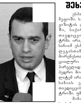
ესპანეთის საემბელიის სამდილიანი ვიზიტის ფარგლებში, საქართველოს თავდაცვის მინისტრმა ირაკლი ალასანიამ ესპანელ კოლეგასთან პედრო მორენოსთან ოფიციალური შეხვედრა პირველად გამართა. პედრო მორენოს ეუბნებენ ესპანელი ალასანიას ესპანეთის თავდაცვის სამინისტროში უმასპინძლა. მინისტრებმა საქართველოსა და ესპანეთის სამეფოს შორის თავდაცვის სფეროში ორმხრივი თანამშრომლობის განვითარების პერსპექტივები განიხილეს. განსაკუთრებული ყურადღება წერეთისა და განათლების სფეროებზე გამახვილდა.