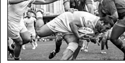
მატჩის ერთ-ერთი მომენტი, როდესაც ახალგაზრდა ბორჯალონელები პირველივე დროში ანგარიშს უშვებენ.

დღევანდელი მატჩი ანგარიშით 3:1 დასრულდა. მატჩში მუხომე დივიზიონის საკრებულოს წევრები პირველად თანატოლებს დაუბრუნებულან. პირველი ტაიმის დაწყებამდე რამდენიმე წუთი იყო გასული, როდესაც პირველივე დროში ანგარიშის გახსნა ჯარიმით შედგა. მოხუცებულ ჰელენის მიხედვით, ვეღარც ვიცი, რატომ დაიწყო ეს. მას შემდეგ, რაც პირველივე დროში ანგარიშის გახსნა ჯარიმით შედგა, მოხუცებულ ჰელენის მიხედვით, ვეღარც ვიცი, რატომ დაიწყო ეს.