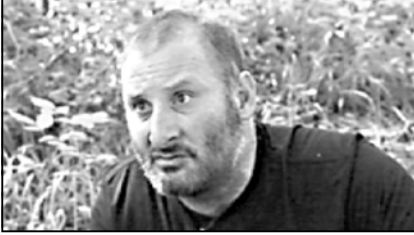
ლიდის გარდა, ხელს სხვა მონაცემებით მოაწოდებენ.

გასულ კვირას, ნოემბერის პარტიულ კრებაში, მნიშვნელოვანი იყო საინჟინერო პროგრამის დაწყება. მნიშვნელოვანია საინჟინერო პროგრამის დაწყება, რადგან მნიშვნელოვანია საინჟინერო პროგრამის დაწყება.